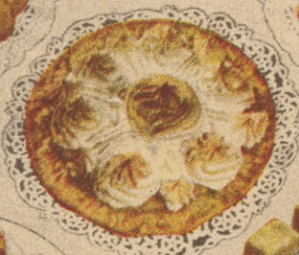
Tarte au Sirop d'Erable