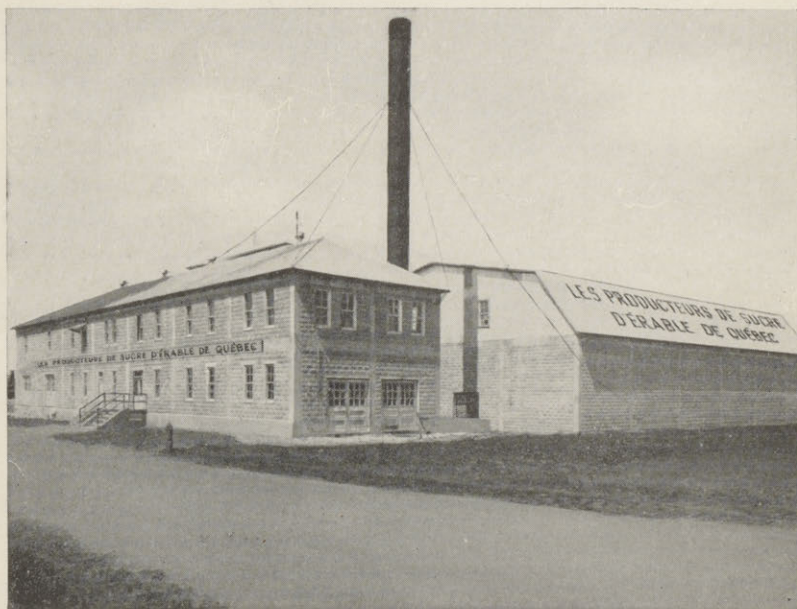
Manufacture et entrepôt de la Société des Producteurs de Sucre d'Érable de Québec, à Plessisville, Co. Mégantic

NoKomis aurait été le premier à percer des trous dans le tronc des érables et à recueillir la sève. Manabush, constatant que cette sève était un sirop prêt à manger, alla trouver sa grand'mère et lui dit: “Grand'mère, il n'est pas bon que les arbres produisent du sucre aussi facilement. Si les hommes peuvent ainsi sans effort recueillir du sucre, ils ne tarderont pas à devenir paresseux. Il faut tâcher de les faire travailler. Avant qu'ils puissent déguster ce sirop exquis, il serait bon que les hommes soient obligés de fendre du bois et de passer des nuits à surveiller la cuisson du sirop”. Il n'en dit pas plus long, mais, craignant que NoKomis ne fût indifférente à ses paroles qu'elle n'omît de prendre des mesures pour empêcher les hommes de devenir paresseux, il grimpa au haut d'un érable avec un vaisseau rempli d'eau et en versa le contenu à l'intérieur même de l'arbre dissolvant ainsi le sucre qui se trouvait dans l'érable. Depuis ce temps, au lieu d'un sirop épais, la sève contient 1% à 2% de sucre, et, pour obtenir du sucre, il faut dorénavant travailler. Cette légende prouve au moins que les indiens possédaient les méthodes rudimentaires de la fabrication du sucre d'érable.