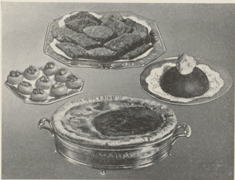
Fondant à l'Érable, Cossetarde à l'Érable, Cookies à la farine d'avoine, Mousse à l'Érable.

Aujourd'hui, grâce aux méthodes modernes enseignées par les instructeurs du Département de l'Agriculture de Québec et au zèle des directeurs et des membres de la Société des Producteurs de Sucre d'Érable de Québec, le consommateur est désormais sûr de trouver sur le marché un produit bien clarifié, bien présenté, classifié avec méthode, absolument pur et d'une qualité insurpassable.