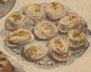
Petits gâteaux au Sirop d'Erable