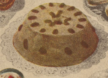
Gâteau au Sirop d'Erable