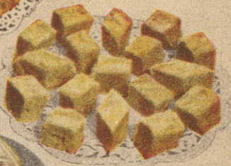
Sucre à la crème au Sirop d'Erable