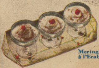
Meringue à l'Erable