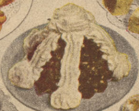
Pruneaux au Sirop d'Erable