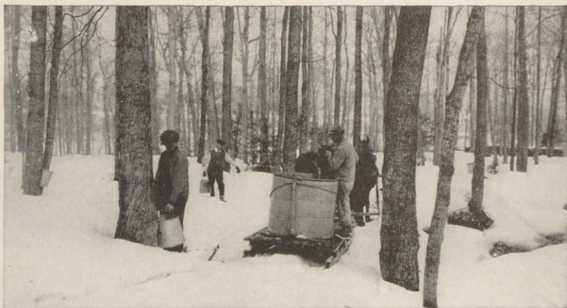
La récolte de la sève