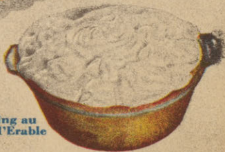
Pouding au Sirop d'Erable