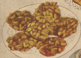
Arachides croquantes au Sirop d'Erable