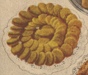
Biscuits au Sirop d'Erable