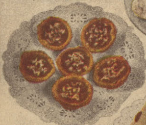
Tartines au Sirop d'Erable