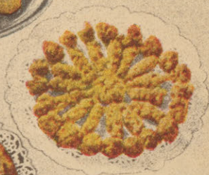
Riz crispé au Sirop d'Erable