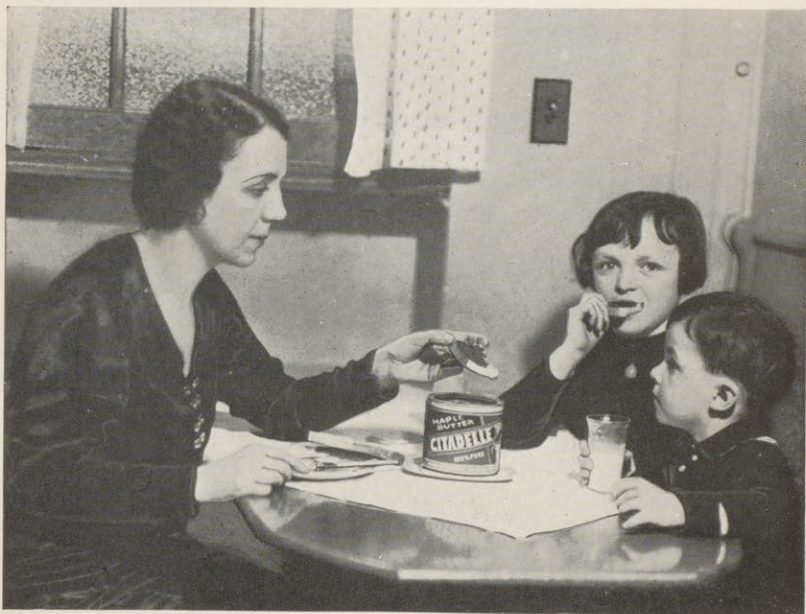
Rien n'est meilleur pour la collation des enfants qu'une tartine au beurre d'Erable

Chaque membre de cette société reçoit en entrant un numéro matricule. Une étiquette, portant ce numéro, doit accompagner toutes les expéditions faites à la Société. De cette façon, il est facile de découvrir les coupables s'il y a tentative de fraude. Le sirop, dès qu'il parvient aux entrepôts de la Société, est inspecté et classifié par des officiers du Ministère de l'Agriculture de Québec et d'Ottawa.